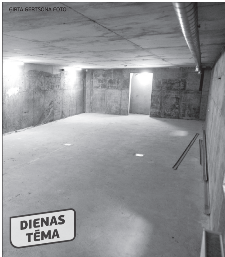
Viena no potenciālajām vietām, kur iedzīvotāji var patverties militāra uzbrukuma laikā, ir Latvijas Bankas bijusās filiāles pagrabs (attēlā) un arī seifa telpa virs tā.

Lai rastu vismaz kādu patvērumu militāra apdraudējuma gadījumā, novadnieki varot doties uz ēku pagrabiem, taču A.