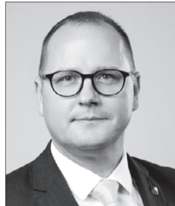
Raimonds Čudars, klimata un enerģētikas ministrs

Ne tikai Liepājā, bet Latvijā kopumā izaicinājumi saistīti ar transporta sistēmas zaļināšanu, lauksaimniecību un enerģētiku, tai skaitā māju siltināšanu. Liepājā ir pavisam skaidra vīzija un plāni, tie ir ambiciozi un rada pozitīvu iespaidu uz visas valsts siltumnīcefekta gāzu (SEG) emisiju samazināšanu. Liepāja domā par to, kā pilsētas mežu teritoriju iekļaut kopējā SEG emisiju samazināšanas plānā, definējot to kā CO 2 piesaisti, kas ir jauna pieeja.